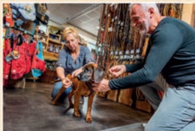
Persoonlijk advies & pas service