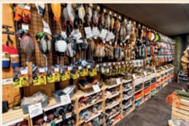
Grote diversiteit aan dummy's