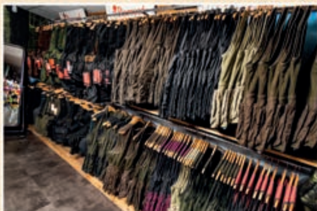
Alles op voorraad in vele kleuren en maten