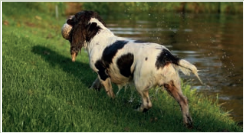
Aandacht Edge tijdens het waterapport in Fressin.