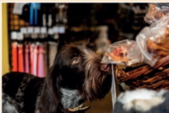
Honden zijn natuurlijk van harte welkom