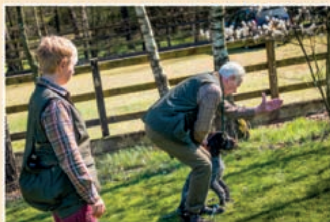
Trainingstips en/of advies op maat