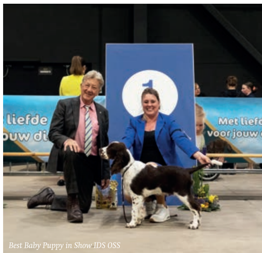
Best Baby Puppy in Show IDS OSS

Maar als je het mij vraagt ga ik het liefst elke dag naar school. Zie de foto's van mijn dagelijkse werkzaamheden.