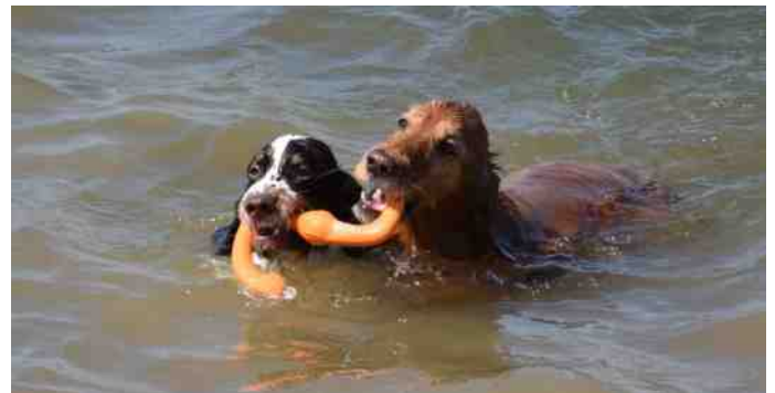
Samen is alles leuker!

Dat is niet haar sterkste kant. Waar Gijs is, wil zij ook zijn. Om haar alvast een beetje voor te bereiden lieten we haar even vanaf de waterkant springen.