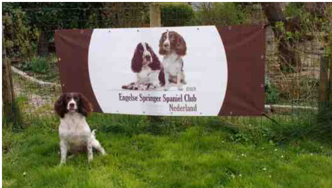
Het nieuwe spandoek van de club met het nieuwe logo!

Fronsend kijken we zaterdag naar alle materialen en voorraden voor de Springerdag: Een 6 liter waterkoker, grillplaat, koffiezet apparaat, dozen met brood, frisdrank, hamburgers, een paar kratten bier, een koeler met hamburgers, kaas, vleeswaren, papieren cups en borden, keukenen wc papier. Zou het in de auto's passen en kunnen onze eigen honden dan ook nog wel mee?