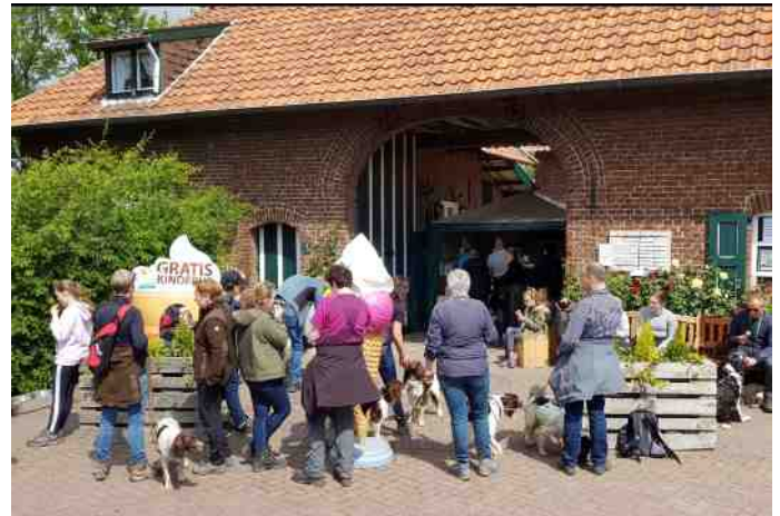
Een lekker koel ijsje na de wandeling!

wisselden zich af met veldwegen, en we genoten van de vele mooie vergezichten.