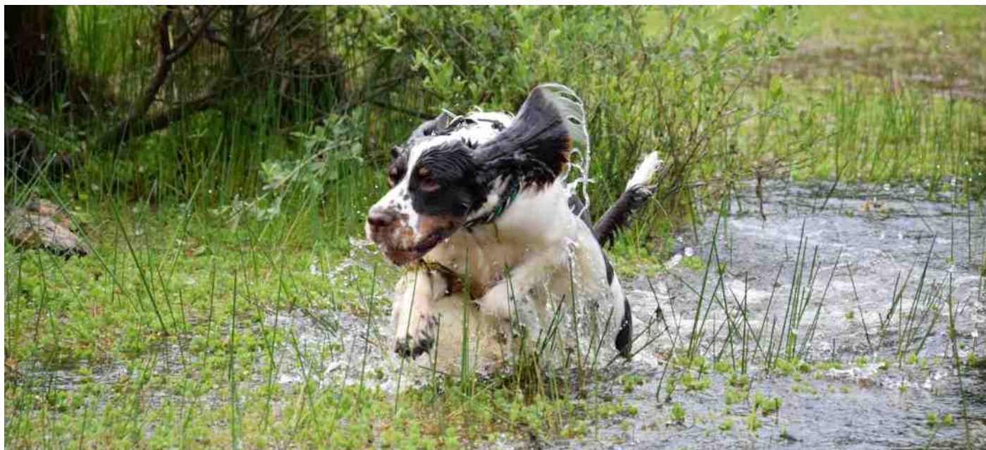
Lekker het water in als het warm is!

Kijk voor een overzicht van schone en veilige zwemlocaties op www.zwemwater.nl