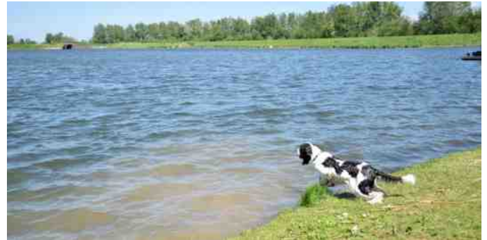
Eerst van de kant.

geweldig! Dus toen ze de leeftijd van 15 maanden had, zijn we gaan proberen of zij ook van het Dock af wilde springen. Het is niet gezegd dat elke hond, die graag zwemt of alle plassen inspringt, ook van het dock wil springen.