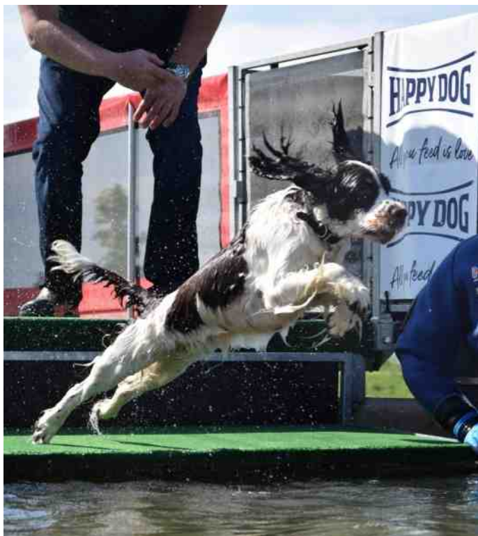
Zonder na te denken, prachtige sprong, we zijn trots op haar!