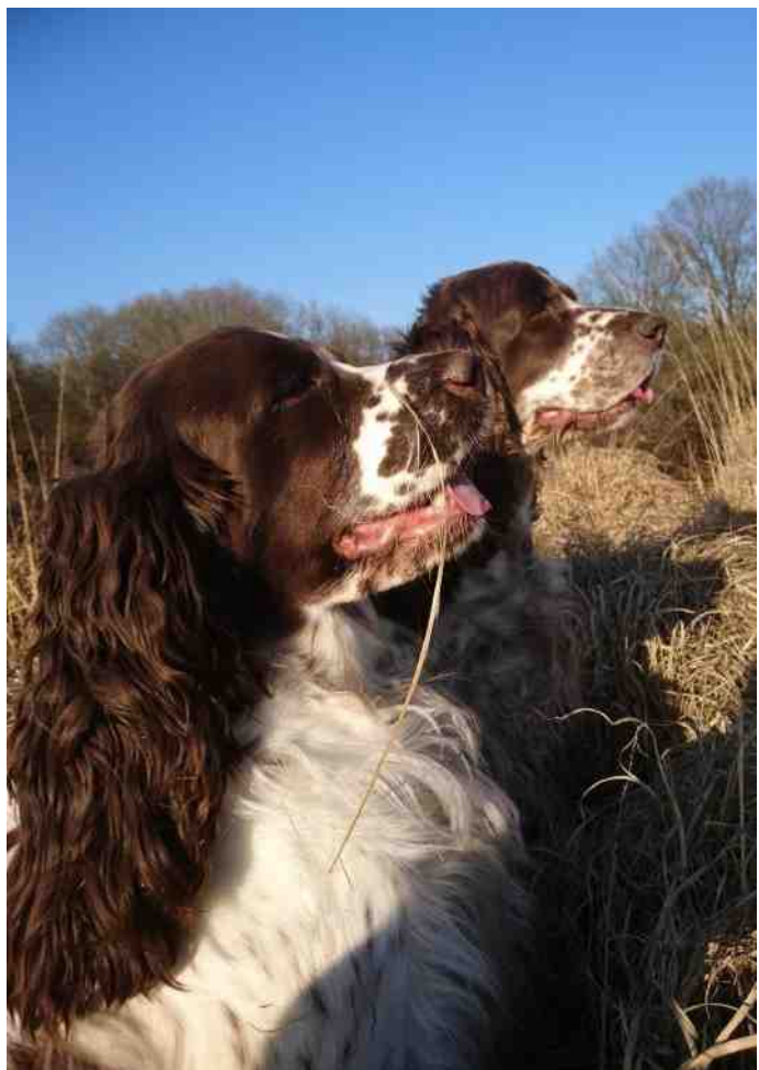
Maron en Muze op de heide.