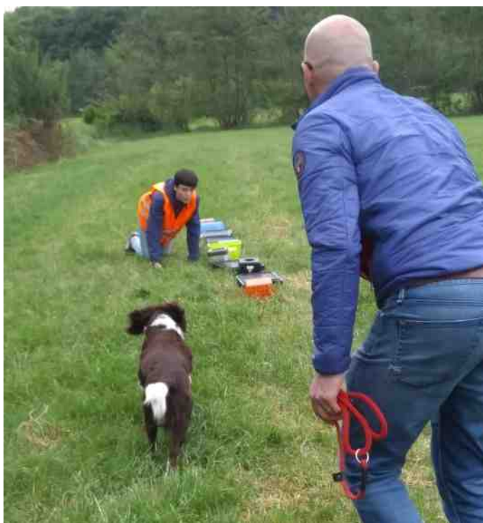
Meedoen met detectieoefening.