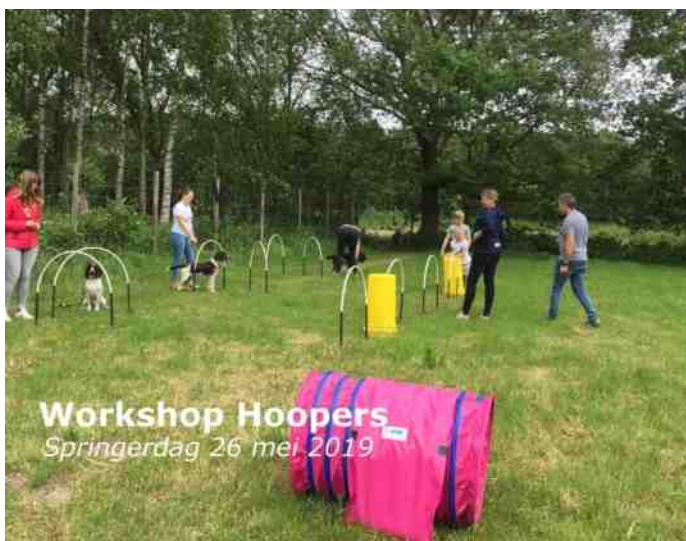
Workshop Hoopers Springerdag 26 mei 2019

Als laatste onderdeel van de dag stond de scurry gepland. Ik was gelukkig niet de enige die niet wist wat het inhield! Bij de scurry moet de hond zoveel mogelijk dummy's ophalen en bij de baas brengen in zo kort mogelijke tijd. Zelf vond ik de jonge Cocker Spaniël erg indrukwekkend! Wat heeft dat beestje gerend! Super leuk om te zien. Wie er nu uiteindelijk gewonnen heeft? Ik moet je de uitslag schuldig blijven, maar voor mij persoonlijk doet dat er minder toe, het was gewoon een aardig schouwspel de honden te zien rennen, zoeken en te apporteren bij de baas.