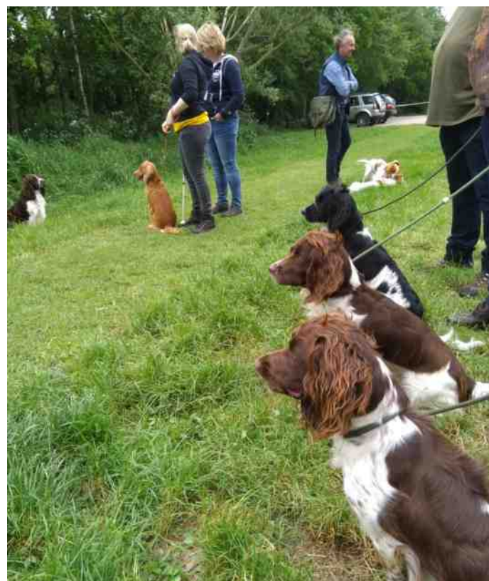
Springers hebben aandacht voor de scurry.

Gedurende de hele dag was er de mogelijkheid om je hond kennis te laten maken met hersenspelletjes. Er waren spelletjes neergelegd met uitleg erbij. Bijvoorbeeld een snuffelmat waar je een voertje in kunt leggen die je hond dan moet zoeken, of een voertje tussen ballen in een bak. Lekker neuswerk voor de honden.