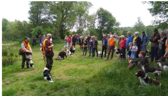
Aandachtig luisteren naar uitleg over voor het schot jagen en demo met jonge en oudere hond. Ook steadyness kwam aan bod.

Ik hoop maar dat er nog meer mensen enthousiast zijn geworden, onze Springers hebben nu eenmaal een super neus en honden vinden speurwerk gewoon erg leuk én, maar tegen wie zeg ik het, werken met je hond is nu eenmaal leuk.