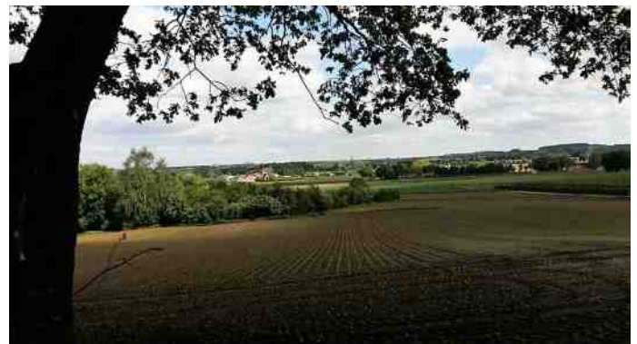
Het mooie Limburgse heuvelland.

Halverwege de wandeling hielden we pauze bij de "Ijspoort" waar we genoten van een overheerlijk ambachtelijk bereid Italiaans schepijsje. We vervolgden onze weg lekker door het bos en iedereen genoot. De wandeling sloten we af met voor de honden een heerlijke zwemmogelijkheid in de beek en voor de baasjes een lekker stuk Limburgse vlaai. Als groep zijn we steeds samen gebleven, dit maakte het allemaal nog veel gezelliger en geslaagder.