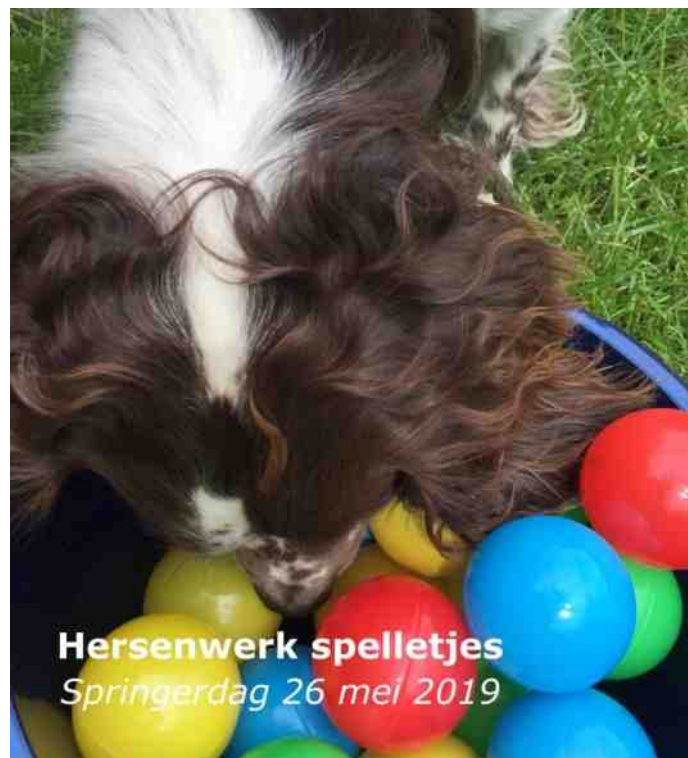
Hersenspelletjes Springerdag 26 mei 2019

Als laatste onderdeel van de dag stond de scurry gepland. Ik was gelukkig niet de enige die niet wist wat het inhield! Bij de scurry moet de hond zoveel mogelijk dummy's ophalen en bij de baas brengen in zo kort mogelijke tijd. Zelf vond ik de jonge Cocker Spaniël erg indrukwekkend! Wat heeft dat beestje gerend! Super leuk om te zien. Wie er nu uiteindelijk gewonnen heeft? Ik moet je de uitslag schuldig blijven, maar voor mij persoonlijk doet dat er minder toe, het was gewoon een aardig schouwspel de honden te zien rennen, zoeken en te apporteren bij de baas.