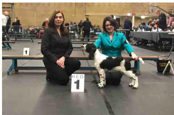
Eerste show KC Rijssen

Gaande weg heb ik zijn gebruiksaanwijzing kunnen vertalen (tja Pools is niet mijn sterkste kant) en opeens was daar een ontzettend leuke, lieve leergierige jonge hond. Geen poespas, niet te veel mutsen, gewoon doen. Oja en natuurlijk knuffelen is ook best fijn.