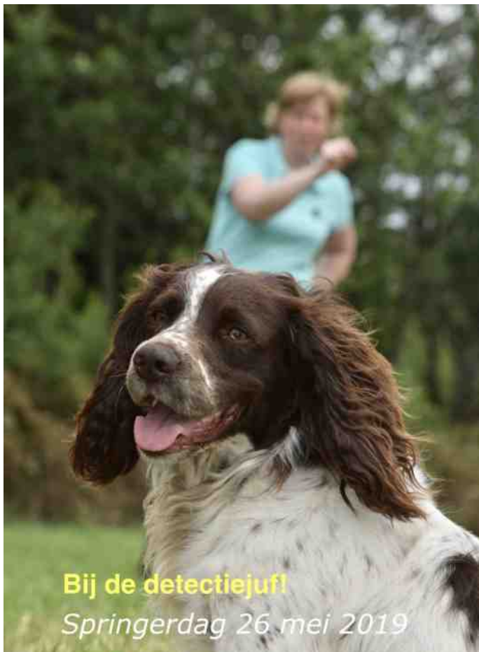
Bij de detectiejuf! Springerdag 26 mei 2019