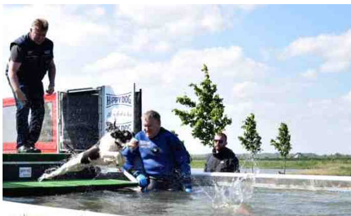
Prachtige eerste sprong.