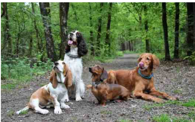
Geduldig poseren voor het vrouwtje!

Jacht demonstratie Springerdag 26 mei 2019