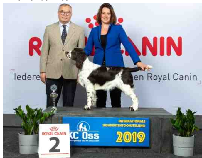
Beste pup en reserve BIS Puppy.