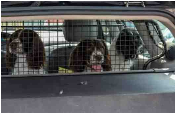
De honden zitten nieuwsgierig in de auto te kijken waar ze heen gaan.

Veel mooier is om eraan terug te denken! Aan al die geweldige mensen en Springers die het mogelijk hebben gemaakt. Aangezien we met de papa, mama, broertjes en zusjes van Jax vaak samen wandelden, leek het mij leuk om ook meer Springers kennis te laten maken met de mooie omgeving waarin wij wonen, en waarin vooral de honden mogen (los)lopen.