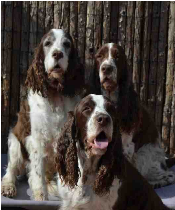
De drie Broers!