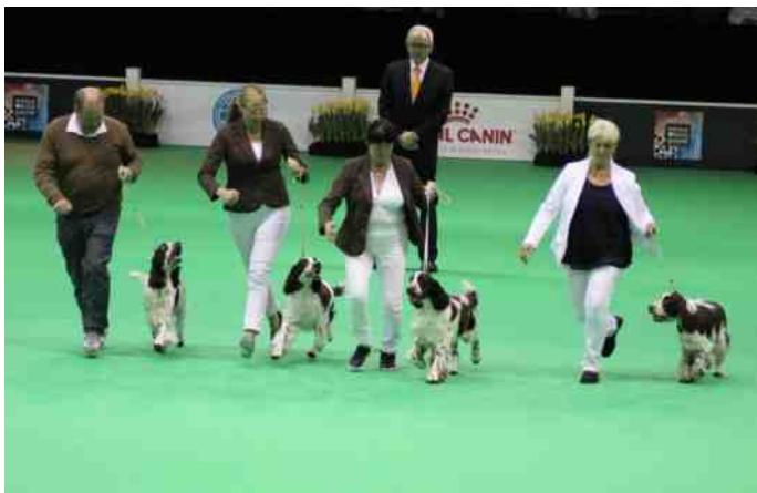
Groep Barecho tijdens de World Dogshow in Amsterdam.