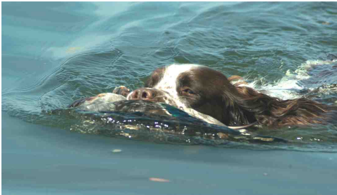
SJP Haafden.