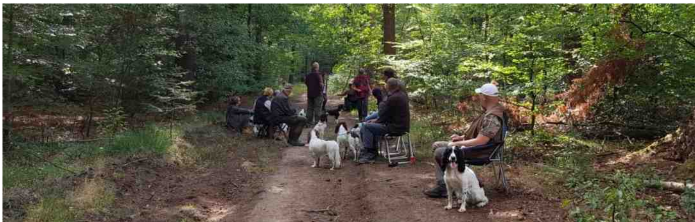
Certificaatdag Zelhem.