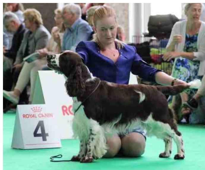
Gilroy (Ch.Lochbride Music Man Via Dexbenella) werd uiteindelijk 4e in deze klasse!

Gilroy (Ch.Lochbride Music Man Via Dexbenella) was als eerste aan de beurt in de openklas. Deze klas had een inschrijving van 10 reuen. Na de individuele keuring maakte de keurmeester een selectie van 4 reuen. Gilroy was één van deze reuen. De keurmeester liet ons behoorlijk wat rondjes lopen voordat hij zijn besluit had genomen, Gilroy werd uiteindelijk 4e in deze klasse!