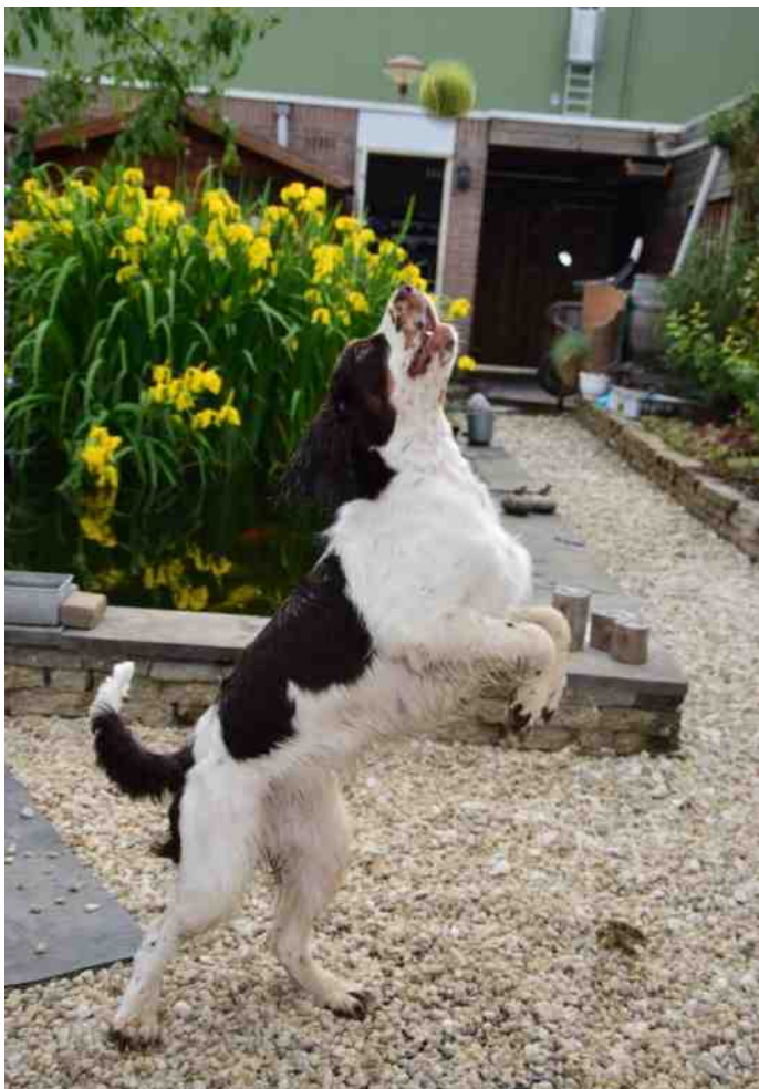
Altijd in voor een spelletje!

aanhankelijk hondje. Ze volgt me overal en wacht geduldig onderaan de trap tot ik weer naar beneden kom. Wanneer ik opsta, heb ik meteen oogcontact met haar. Ze kan niet praten, maar haar blik zegt me nu al meer dan genoeg! Ze is helemaal verzot op knuffelbeestjes en op ballen apporteren!!! Daar kan ze ook echt niet mee stoppen! Ze komt ze steeds weer terug brengen, laat netjes los, maar weet echt van geen ophouden! Ik moet haar spulletjes echt opbergen. In ruil daarvoor krijgt ze een kluijfe. Dat werkt goed en dan hebben we ook zeker wel eens een rustmomentje in huize Sijbrandij...haha!