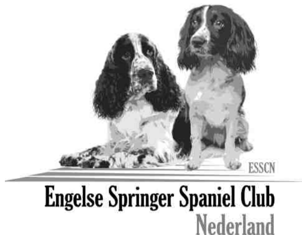
FOTO VOORKANT: Flynn "Crackerjanne Court Favour"

Bestuur en redactie zijn niet verantwoordelijk voor de inhoud van advertenties en ingezonden stukken, maar kunnen deze wel weigeren indien de inhoud strijdig is met de doelstelling en de regels van de Engelse Springer Spaniël Club Nederland. De redactie behoudt zich het recht voor om ingezonden stukken, in overleg met de inzender, in te korten of, als meerdere stukken dezelfde strekking hebben, niet te plaatsen. Overname van artikelen uit dit blad mag alleen na toestemming van de redactie