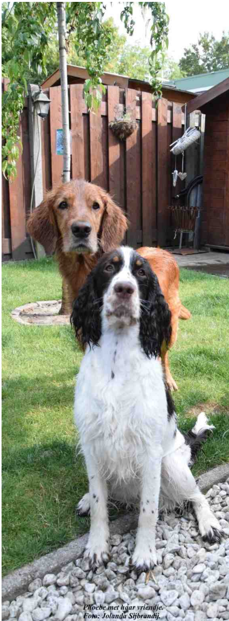
Phoebe met haar vriendje.