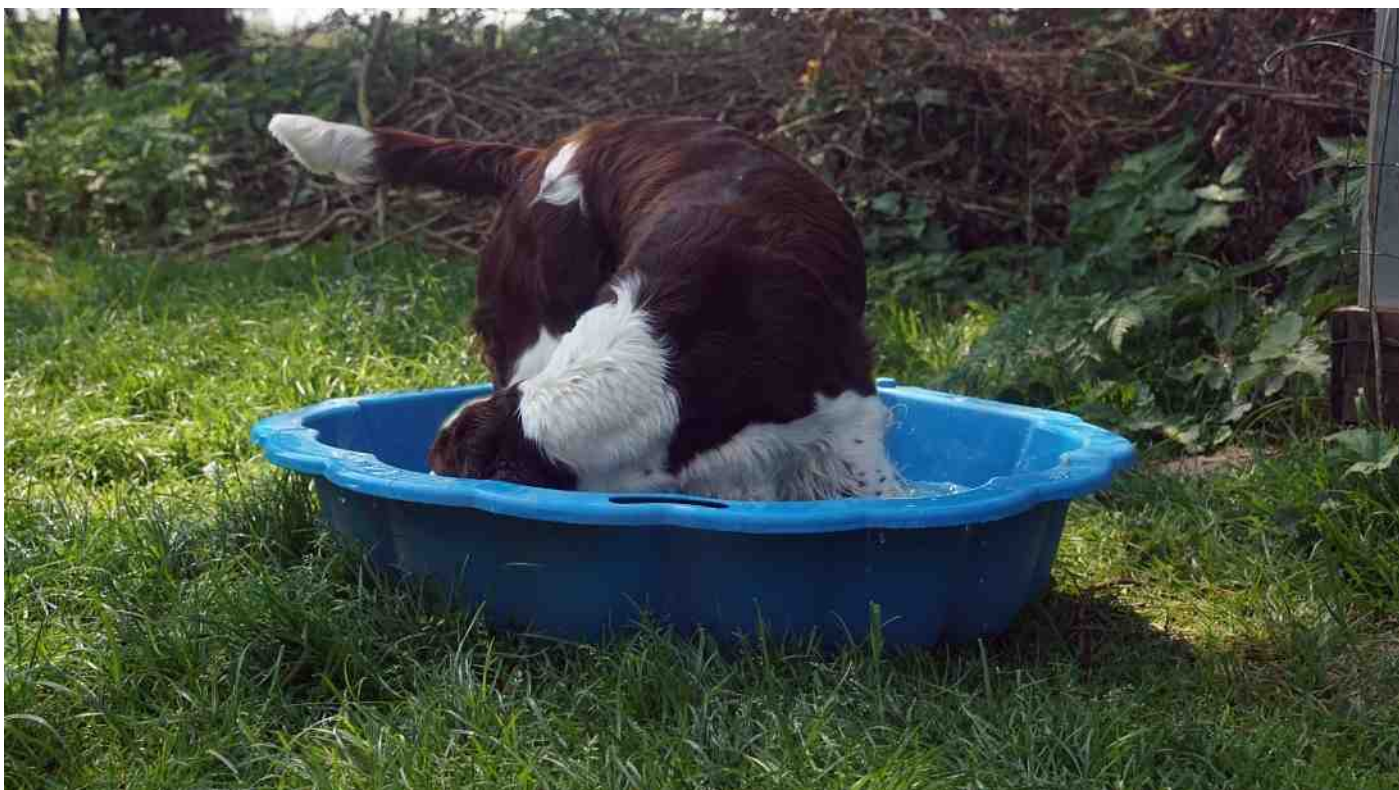
Hazel heeft het erg naar haar zin in haar zwembadje, ze doet graag een duikboot na!