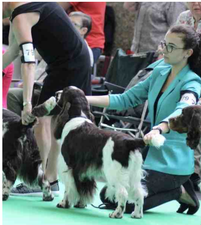
Flynn "Crackerjanne Court Favour" kreeg een mooie uitmuntend als kwalificatie.

Wat ik echter wel jammer vond was dat de Nederlandse Springers alleen door familie Van den Brink van 't Veense Springertje en door onszelf, van de Engelse Springer Hoeve, vertegenwoordigd werden. Het was een mooie kans geweest om te zien hoe de Nederlandse Springers zich standhouden op het wereldtoneel. Desalniettemin denk ik dat 't Veense Springertje en de Engelse Springer Hoeve trots kunnen zijn op onze bijdrage aan en resultaten van deze editie van de World Dog Show!