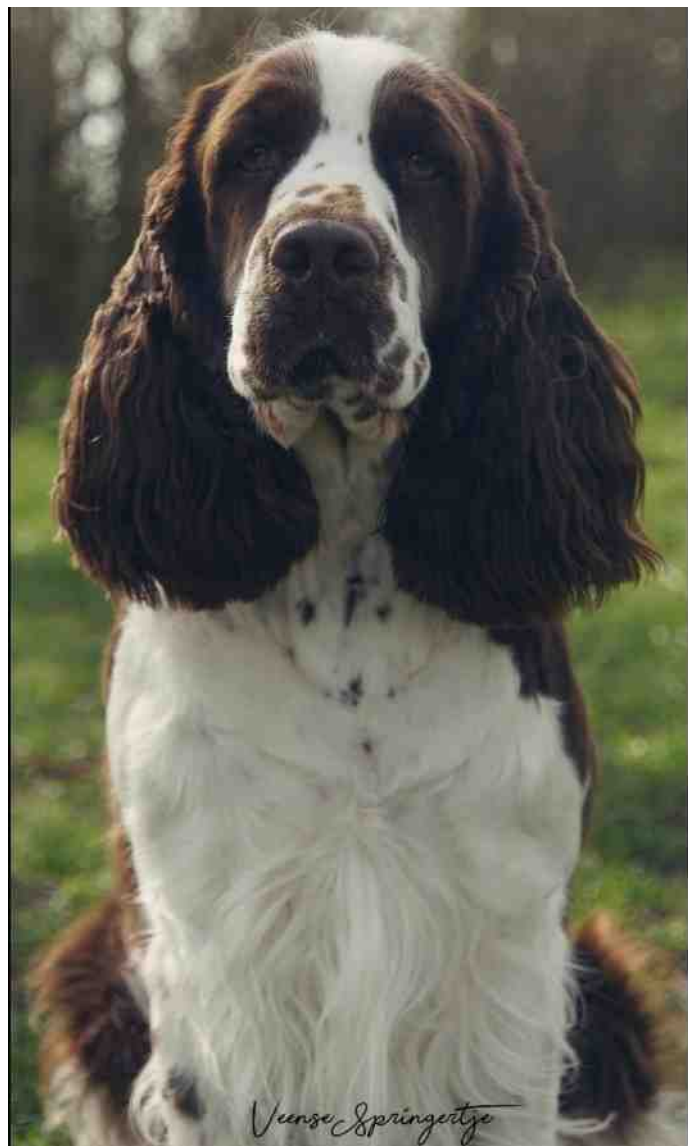
Hazel, foto: Daphne v.d. Brink.