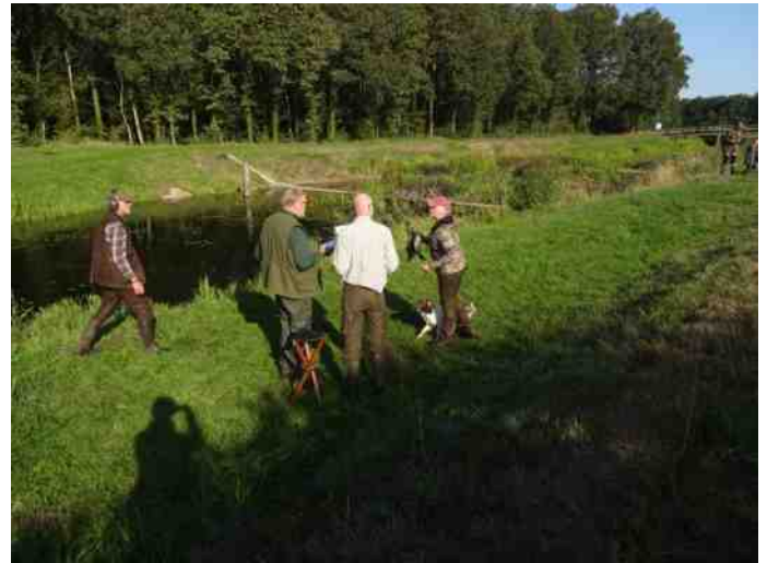
Uitleg wat er moet gebeuren.

Dat was natuurlijk niet het geval. Gelukkig ging Elly voorop rijden om ons naar de veldplek te leiden.