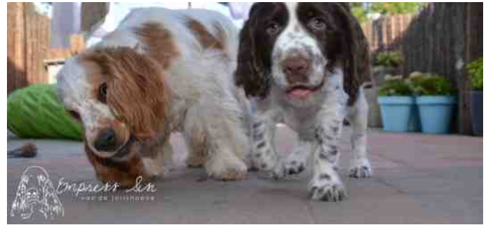
Cocker Sisi geniet van de puppen.