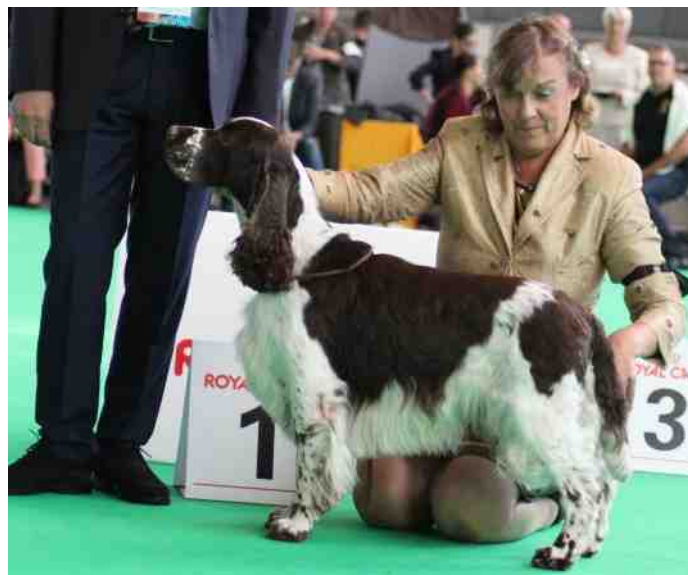
Adamant's Furtue is Future: Best working dog.

Aan de kant van de ring kan je veel beter zien hoe de honden bewegen, voor gebracht worden en gedragen in en buiten de ring. De Engelse Springer is een fantastische verschijning, stuk voor stuk vrolijk, het verschil in typ is goed te zien en dit blijft een persoonlijke voorkeur, ik heb zeer goede typische Springer gangwerken gezien maar vooral de lol die de honden hadden. Wij hebben echt een prachtig ras.