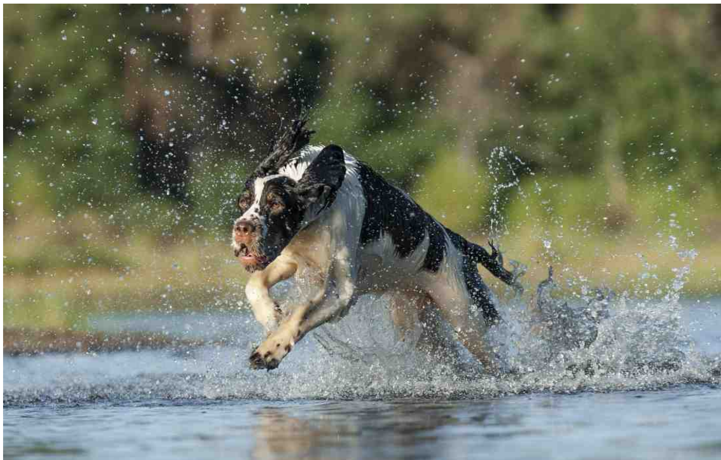
Phoebe, eig.: Jolanda Sijbranbij.