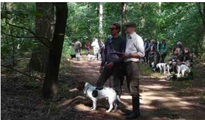
Certificaatdag Zelhem.