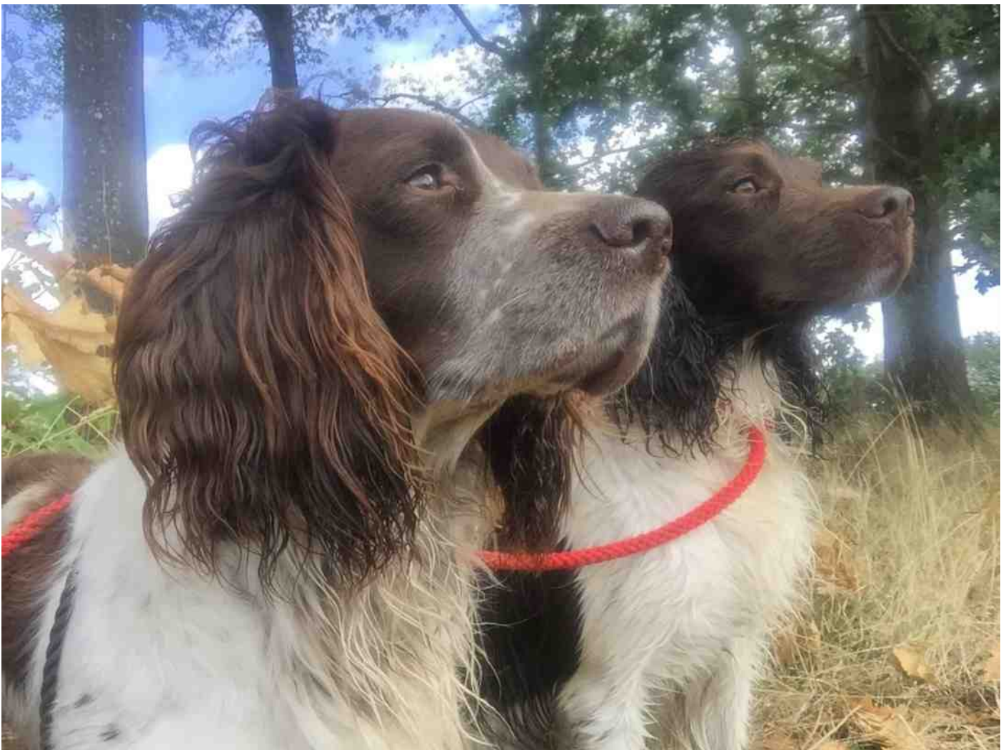
Scout en Bodey op de working test in Lochem, foto Leontien Bouchier.

S.T. Leidner, Nieuwe Laaklaan 9, 3881 MH PUTTEN Tel.nr.: 03554-17096 / GSM: 06 48720661 E-mail: sandra.leidner@woutworks.nl