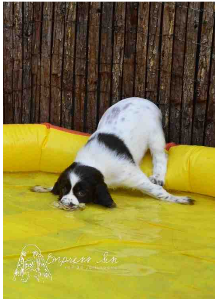
Ozzy, een echte waterrat.

Paul en Annemie Koolen ESS v.d. Jorishoeve